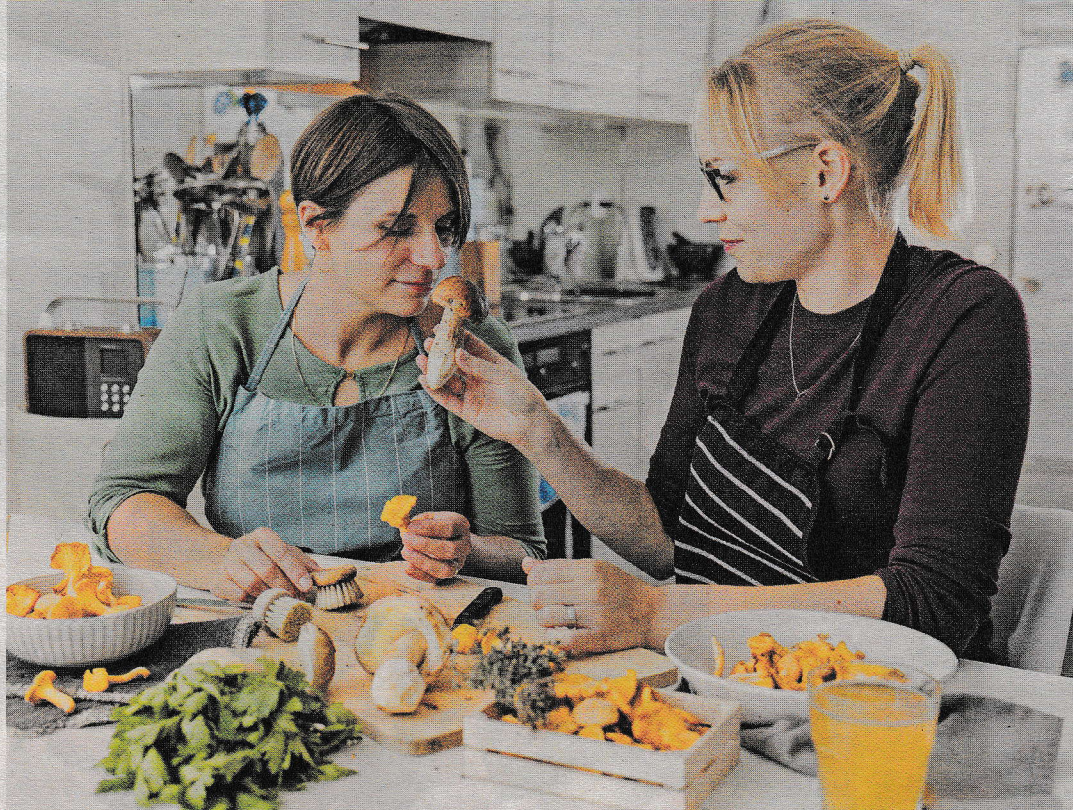
Die Bloggerinnen schwelgen im saisonalen Überfluss der Wildpilze.

Passt zu: Raclette, kaltem Fleisch oder als Topping für Salat und Suppen.